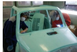
▲社内公募のデザインに塗装（旧車レストア）