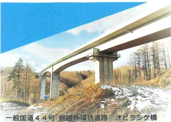
一般国道44号 釧路外環状道路 オヒラシケ橋