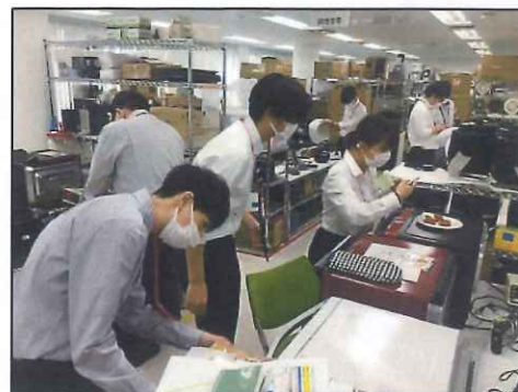
チームに分かれ企画開発