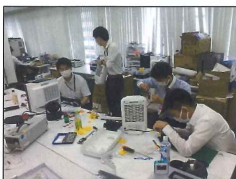
チームに分かれ企画開発