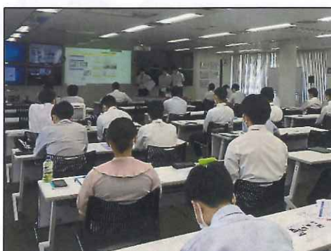
多くの社員が成果報告会に参加