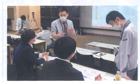
▲最終日の発表の様子