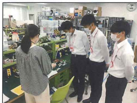
社員からレクチャー