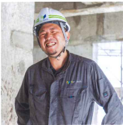
工事部 グループリーダー（施工管理職） 2020年入社