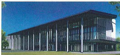
イノベーションハブ 完成イメージ