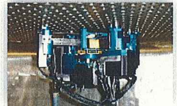
非破壊検査用ロボット